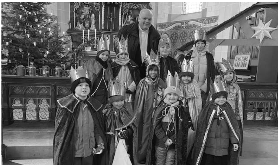
Das Bild zeigt die Sternsingergruppe aus Kennfus.

Ein besonderer Dank gilt allen teilnehmenden Kindern für ihr Engagement sowie den vielen engagierten Unterstützerinnen und Unterstützern der Bolivien- Spendenaktion.